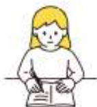
キャリアアドバイザーと 講座を選択・受講スタート