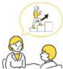
説明会にてキャリアアドバイザーから 講座概要をご紹介

説明会の中で、講座申込をするために必要となる個人情報等に回答いただき、申込方法も併せてご説明します。説明会を聞いて申込を希望されない方は、途中退出も可能となっておりますのでお気軽にご参加ください。