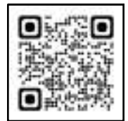
説明会・申込会 予約フォーム

講座申込にあたり、キャンペーン概要を説明会・申込会にてお伝えします。説明会に参加した方のみ本キャンペーンに参加いただけますので、まずは説明会・申込会にご参加ください。日程のご都合が悪い場合は、資格サポート窓口まで直接ご来室ください。