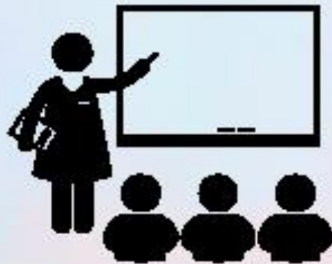
フォローアップ授業回 (対面授業、質問会)